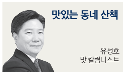
맛있는 동네 산책