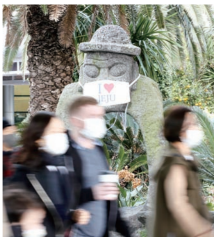
지난해 12월 25일 오전 제주국제공항 1층 도착장에서 관광객이 이동하고 있다.

신종 코로나바이러스 감염증(코로나19) 장기 확산 사태 이후 제주여행과 관련해 '캠핑' '차박' '백패킹' 등 야외에서 소수가 즐기는 활동에 대한 관심이 늘어난 것으로 조사됐다. 제주관광공사가 14일 발표한 '코로나19 전후 제주관광 트렌드 분석' 결과를 보면, 제주여행과 관련한 키워드에서 '캠핑' '오토캠핑' '백패킹' '캠핑카' '오토캠핑' 등 야외 활동에 대한 언급량도 증가한 것으로 나타났다.