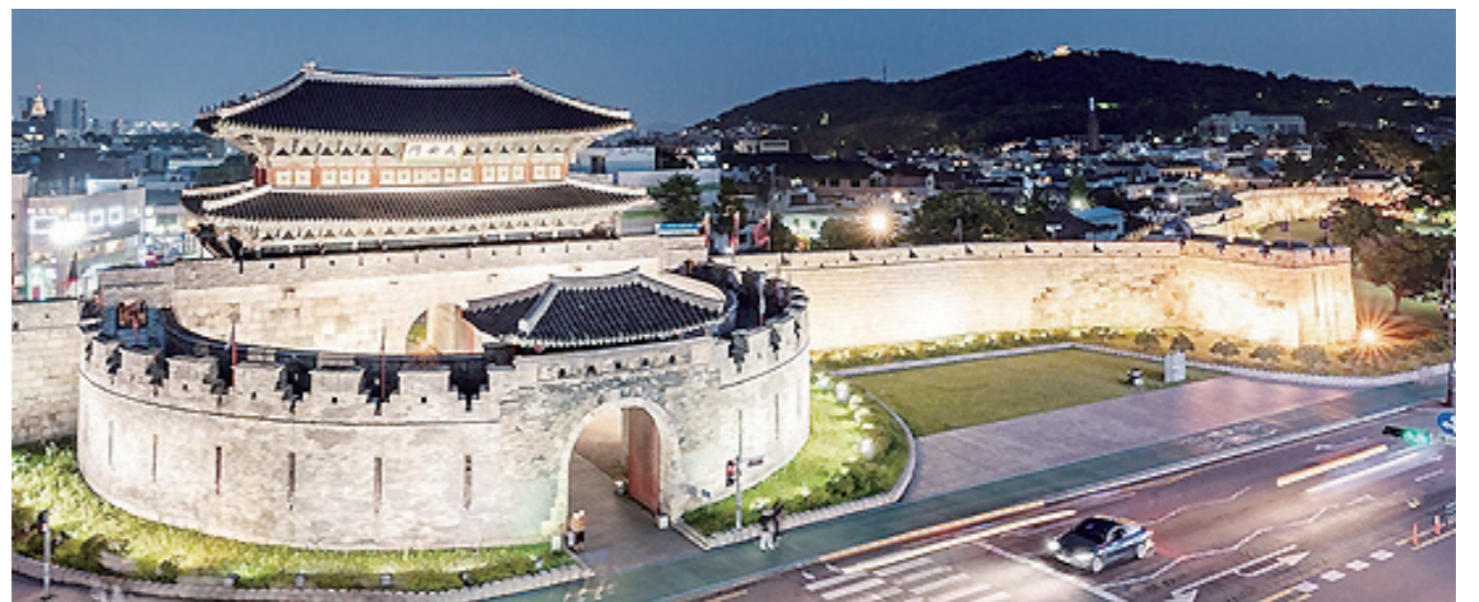
아름다운 수원화성의 정안문 야경. 정조가 능행차를 할 때 지나는 성문이라서 다른 곳보다 크고 화려하다. 성곽을 따라 우측으로 가면 멀리 화홍문이 희미하게 보인다.

정조는 왕위에 머무는 동안 매년 사도세자 탄일을 전후해서 1월 말에서 2월 초 사이 수원 행행을 했다. 1795년 을묘년은 해경궁 흥씨의 회갑을 맞아 다른 때와 달리 성대하게 펼쳐졌다. 해경궁 흥씨와 사도세자는 동갑내기였으므로 여러 가지 의미가 담긴 행행으로 해석된다.