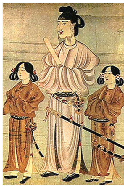
쇼토쿠 태자 초상화 구미이마지

위덕왕은 554~598년까지 45년 동안 재위했다. 백제 후반기 왕 중 비교적 재위 기간이 길다. 그런데 위덕왕 사후 보위를 이은 왕은 아들이 아닌 동생 해왕(28대)이다. 그렇다면 위덕왕에게는 아들이 없었을까?