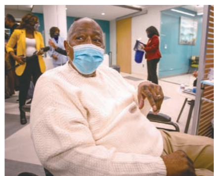
1월 6일 헝크 애런이 코로나 백신 접종을 하고 있는 모습.

1960년대 가장 위대한 선수로 성장한 애런은 1968년 7월 14일 홈구장인 애틀랜타 스타디움에서 자신의 500번째 홈런을 쳤다. 3만4000명이 넘는 관중이 그에게 몇 분 동안 기립박수를 보냈지만 베이브 루스의