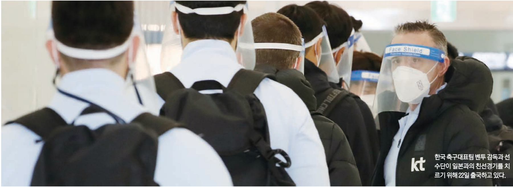
한국 축구대표팀 벤투 감독과 선수단이 일본과의 친선경기를 치르기 위해 22일 출국하고 있다.