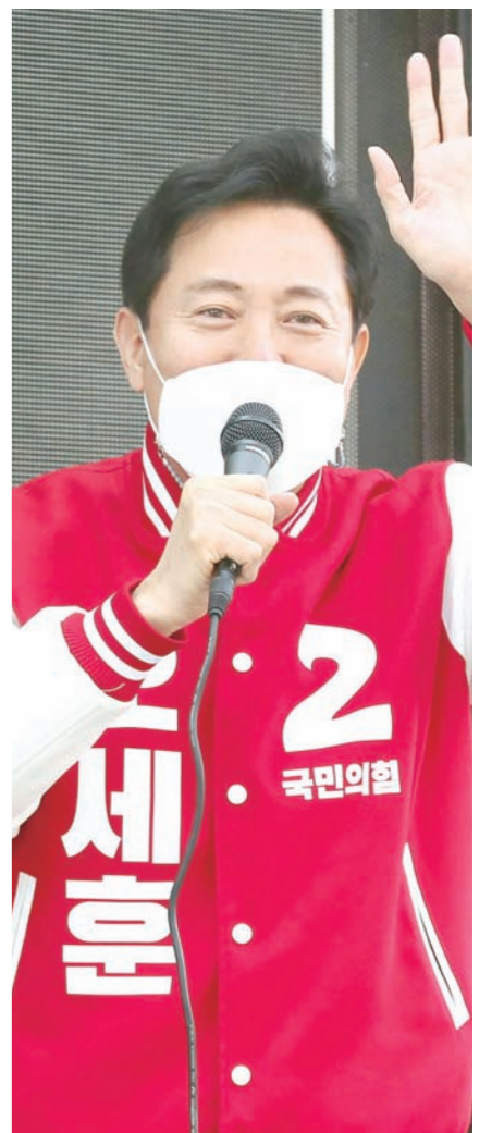
뉴스스 오세훈 국민의힘 후보가 25일 오전 영암역에서 선거유세를 하고 있는 모습.

한편 열세를 보이고 있는 박 후보는 오 후보를 따라잡을 수 있다는 자신감을 내비쳤다. 그는 25일 TBS라디오 김어준의 뉴스공장에 출연해 지지율 격차에 대해 “이번 선거에는 코로나19로 너무 지쳐 있는 서울 시민들을 보듬고 코로나19를 빨리 종식시킬 수 있는 민생 시장이 되어야 한다”며 “저는 딱딱딱 하루에 지지율 2%씩 올릴 자신이 있다”고 밝혔다.