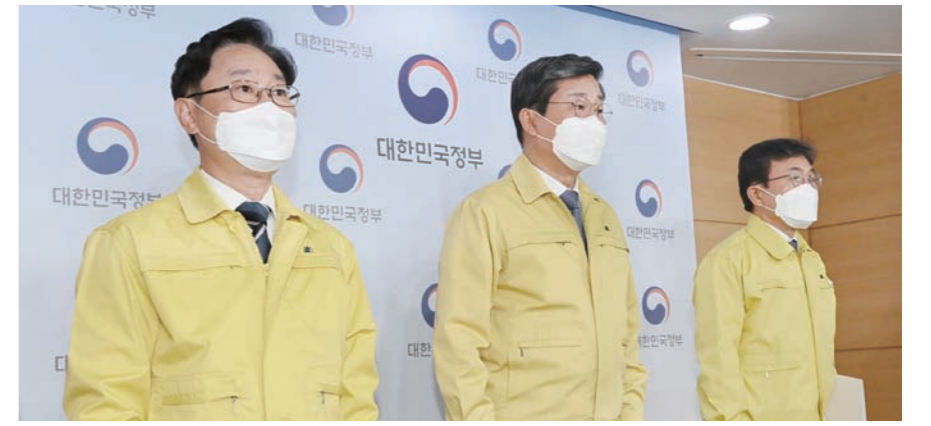
공통취재단 박범계 법무부 장관, 전해철 행정안전부 장관, 권덕철 보건복지부 장관(왼쪽부터)이 25일 오전 서울 종로구 정부서울청사에서 47재보궐 선거를 앞두고 대국민 담화문을 발표하기에 앞서 인사하고 있다.

이들 “코로나19 확산을 방지하고 안전한 선거를 치르기 위해서는 무엇보다 국민 여러분의 적극적인 협조가 필요하다”며 “투표 참여 시 방역수칙을 철저히 준수하여 주시기 바란다”고 당부했다. 조성우 기자