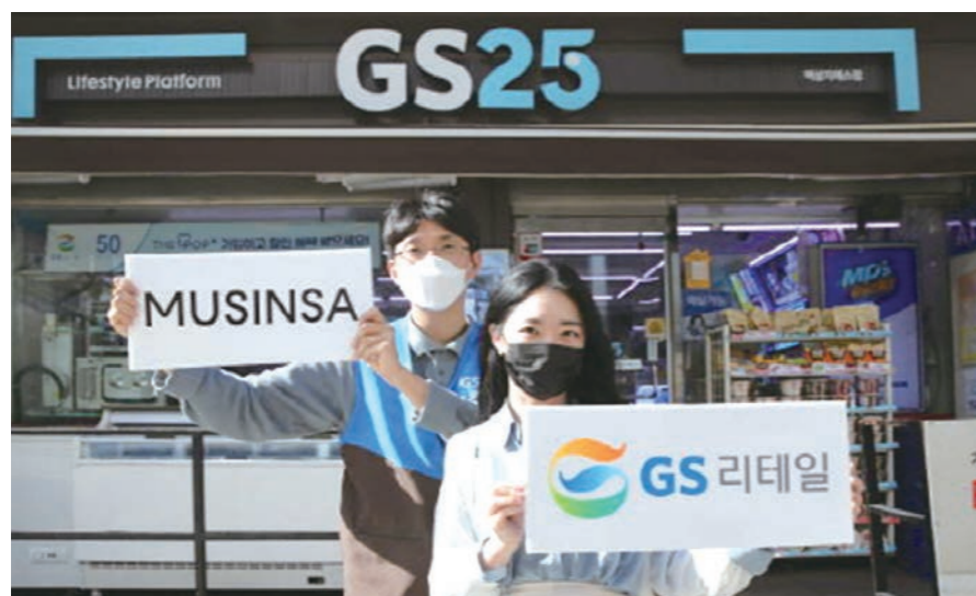
GS리테일이 편의점 취급 상품을 패션까지 끌어올렸다. 온라인 패션 플랫폼 1위 업체인 무신사와 제휴했다. GS리테일

GS리테일(007070)이 편의점 취급 상품을 대폭 늘리고 있다. 영역 파괴 수준이다. GS25에 그동안 편의점에서는 보기 힘들었던 화장품까지 판매하면서 쇼핑 영역을 넓혀왔다.