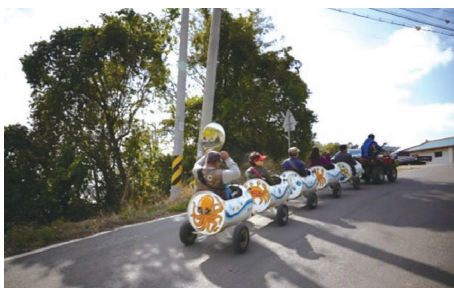
육지에서 300m만 가면 바로 힐링되는 서산 옹도가 한적한 관광지로 각광받고 있다. 드넓은 바다와 갯벌 무인도를 여한 없이 보고 싶다면 힐링의 섬 옹도를 강력하게 추천한다. 이재훈 기자

옹도에는 명물이 하나 있다. 트랙터를 개조해 만든 옹도 일주 강릉 특급 열차다. 옹