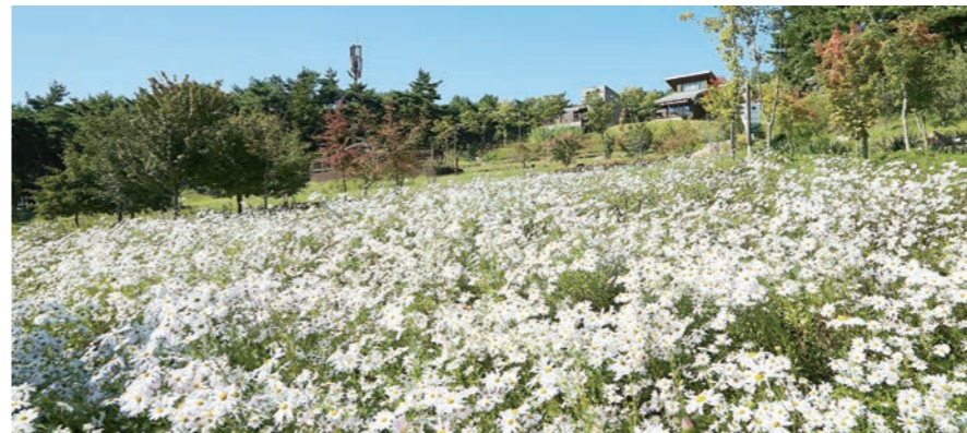
구례수목원의 수국(위)과 지리산정원에 핀 구절초