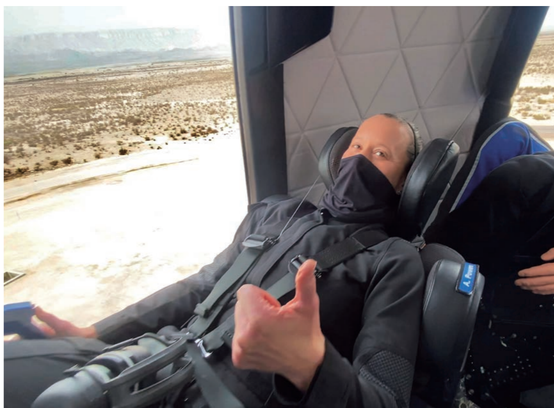
블루오리진의 우주 비행사 시뮬레이션 모습

우주여행이라고 해서 꽤 오랜 시간 우주에 머물 것이라 예상하겠지만 실제로 뉴셰퍼드 로켓 여행자들이 우주에 머무는 시간은 불과 몇 분 정도이다. 로켓이 궤도를 모두 도는 것이 아니라 우주 가장자리까지