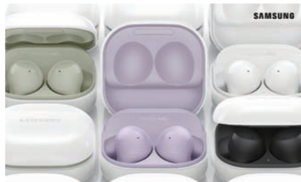
삼성 갤럭시 버즈2

역대 가장 튼튼한 스마트폰 알루미늄 소재인 '아머 알루미늄(Armor Aluminum)'과 'Corning Gorilla Glass Victus™