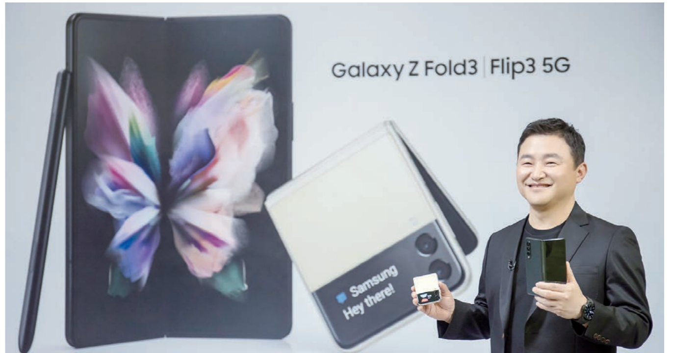
'삼성 갤럭시 언팩 2021'에서 노태문 삼성전자 무선사업부장 사장이 '갤럭시 Z 폴드3'와 '갤럭시 Z 플립3'을 소개하는 모습

사용자가 원하는 다양한 각도로 폴더블폰을 펼쳐서 세워 놓고 사용할 수 있도록 하이드러웨이 힌지(Hideaway Hinge)와