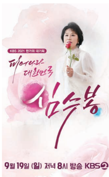
KBS '2021 한가위 대기화-피어나라 대한민국, 심수봉' 포스터

끝으로 심수봉은 "음악 활동은 꾸준히 하고 있다. 좋은 곡이 나올 수 있게 많은