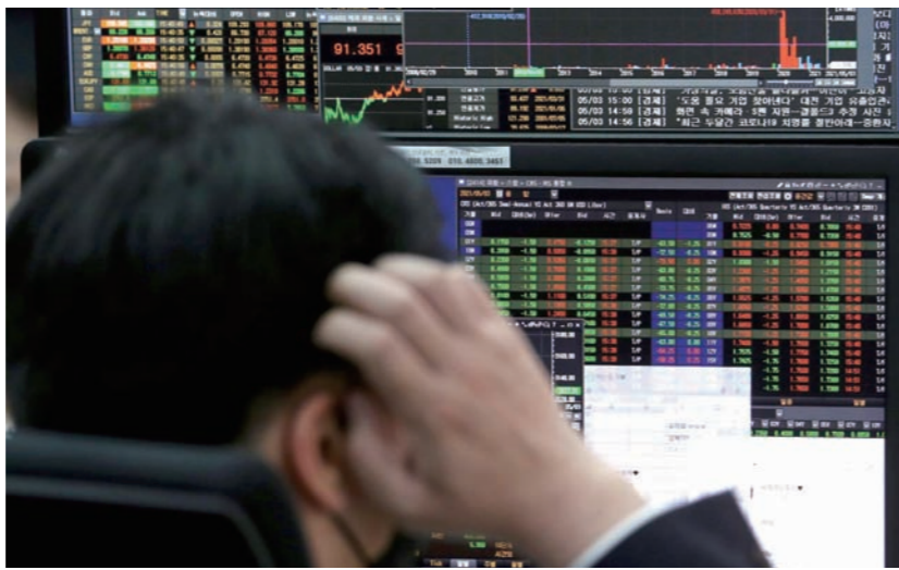
29일 한국거래소에 따르면 이날 코스피는 장 시작과 동시에 2900선이 무너진 2890.78로 시작했다가 11시 13분 현재 0.42% 떨어진 2924.20에 거래 중이다. 사진은 서울 중구 하나은행 본점 딜링룸에서 딜러들이 업무를 보고 있는 모습(왼쪽)과 변이 바이러스.

신종 코로나바이러스 감염증(코로나19)의 변이 바이러스인 '오미크론(Omicron)'이 출현하면서 전 세계 주식시장이 흔들리고 있다. 국제유가 등 원자재 가격마저 급락하면서 회복세로 접어든 글로벌 경제가 다시 뒷걸음질 칠 수 있다는 우려가 나온다. 이런 가운데 증권업계에서는 변이 바이러스로 코스피가 2800선까지 떨어질 수 있다는 부정적인 전망을 내놓고 있다.