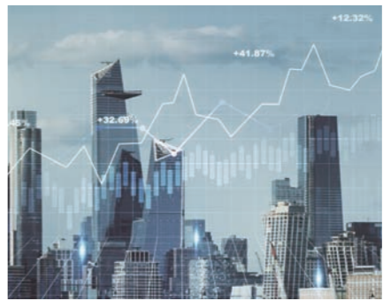
국내 기관투자자들의 올해 3분기 해외 주식과 채권 투자규모가 사상최대를 다시 경신했다.

8억달러 늘어난 1806억달러를 기록했다. 이처럼 3분기 들어 투자액 증가폭이 줄어든 것은 주요국 주가 하락 등의 영향으로 풀이된다. 실제로 3분기 중 주요국의 주가는 대체로 2분기보다 하락세를 나타냈다. 미국 다우지수와 나스닥은 각각 -1.9%와 -0.4%, EU(유럽연합)는 -0.4%, 홍콩은 -14.8% 하락했다. 한은 관계자는 “개인과 법인이 해외 주