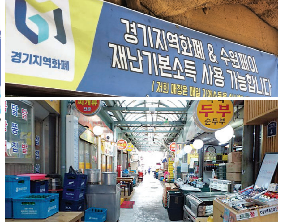
한국조세재정연구원은 연초 발간한 '지역화폐의 도입이 지역경제에 미친 영향'이라는 보고서에서 지역화폐 효과에 대해 "소비의 역외유출을 막아 지역 내 소매업 매출이 증가한다면 이는 동시에 동일한 금액만큼 인접 지자체의 소매업 매출이 감소하는 것을 의미한다"고 지적했다. 사진은 서울 소재 재래시장 내의 한산한 모습.