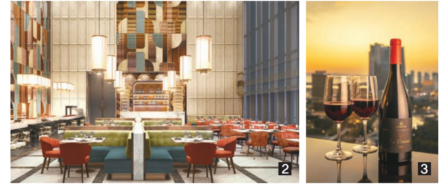
1 그랜드 인터컨티넨탈 서울 클립 그랜드 스위트 2 조선 팰리스 ‘콘스탄스’ 3 셰라톤 그랜드 인천 ‘라운지’

코로나19가 대확산하면서 정부가 11월부터 야심 차게 추진한 ‘위드 코로나’(With Corona)가 사실상 좌초됐다. 정부는 18일 부터 4주간 ‘거리 두기’를 다시 강화하며 확산 차단에 안간힘을 쓰고 있다.