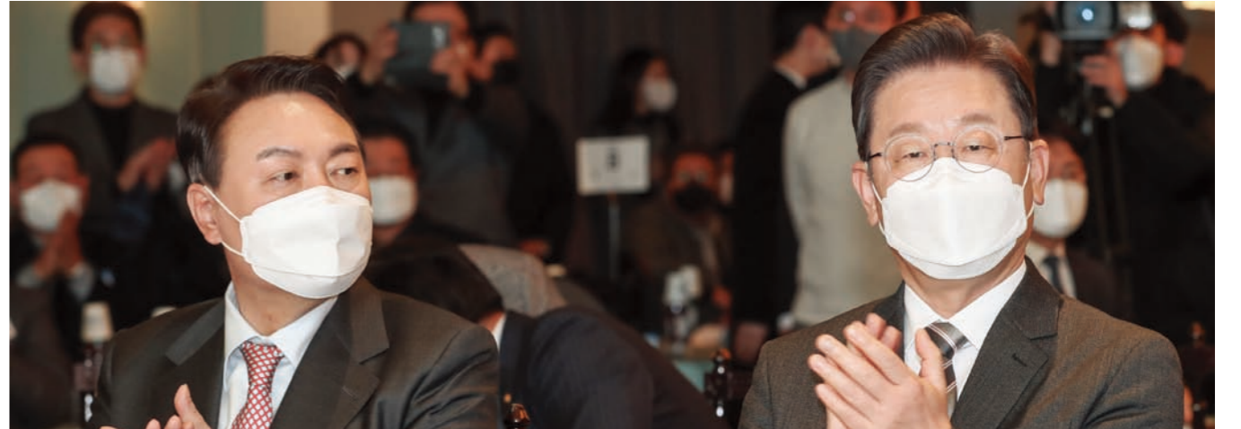
류영준 카카오페이 대표이사(사진 위 왼쪽에서 여섯 번째)가 2021년 11월3일 서울 여의도 한국거래소에서 열린 카카오페이 유가증권시장 신규상장 기념식에 참석해 매매 개시 축하하고 있다. 윤석열(사진 아래 왼쪽) 국민의힘 대선 후보와 이재명 더불어민주당 대선 후보가 18일 서울 여의도 CCMM빌딩에서 열린 2022년 소상공인연합회 신년인사회에 참석해 손뼉을 치고 있다.

대선을 앞둔 정치권도 나섰다. 이재명 더불어민주당 대선 후보는 최근 스톡옵션 행사기간을 규정하는 제도 도입 필요성을 언급했다. 이 후보는 “기관 투자자 의무보유 확약, 우리사주 보호예수처럼 신규 상장기업 경영진의 스톡옵션 행사 기간을 제한해야 한다”면서 “자사주 매각 시 가