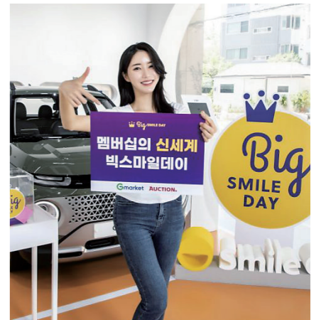
18일 G마켓·옥션 모델이 신설된 빅스마일데이 스마일클럽 전용관을 소개하고 있다.

먼저 빅스마일데이 기간 중 '나만의 캐스퍼'를 만들 수 있는 '현대자동차 캐스퍼 이벤트'를 진행한다. 스마일클럽 회원 누구나 ID당 1회 응모 가능하다. G마켓 또는 옥션에서 '캐스퍼 응모하기' 완료 후 캐스퍼 홈페이지에 접속해 로그인하고 '나만의 캐스퍼 만들기'에 견적 정보를 저장하면 된다.