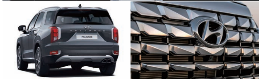
현대자동차가 19일 플래그십 스포츠유틸리티차(SUV) '더 뉴 팰리세이드' 판매를 시작했다.

램프 △2열 워밍 헤드레스트 등 다양한 신규 편의 사양을 기본 적용하고 전용 외장 컬러인 로버스트 에메랄드 핑을 추가해 상품성을 강화했다.