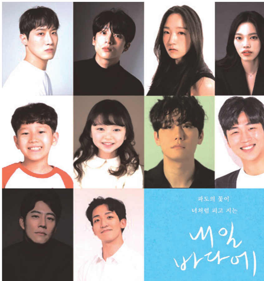
연극 '내일 바다에' 출연진.

떠난 사람과 남겨진 사람 사이에 놓인 작은 간극을 배경으로 재난 이후의 삶을 중점적으로 이야기한다. 후쿠시마 원전 사고 7년 뒤인 2018년, 철도원인 세미는 2011년 사고 당시 소중한 사람을 잃고 나미에 역에서 근무하고 있다. 평범한 일상을 보내는 것처럼 보이는 그의 마지막