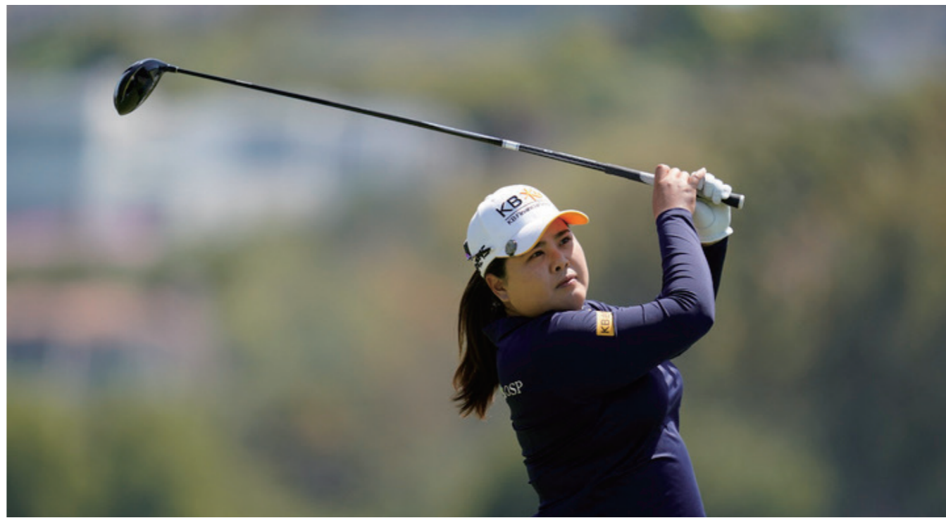
박인비가 4월 미 캘리포니아주 팔로스버디스 에스테이트의 팔로스버디스 CC에서 열린 LPGA 투어 팔로스버디스 챔피언십 3라운드에서 티샷을 하고 있다.

이번 주 여자 선수들의 기량을 테스트하는 데 더 없이 좋은 경기장이 될 것 같