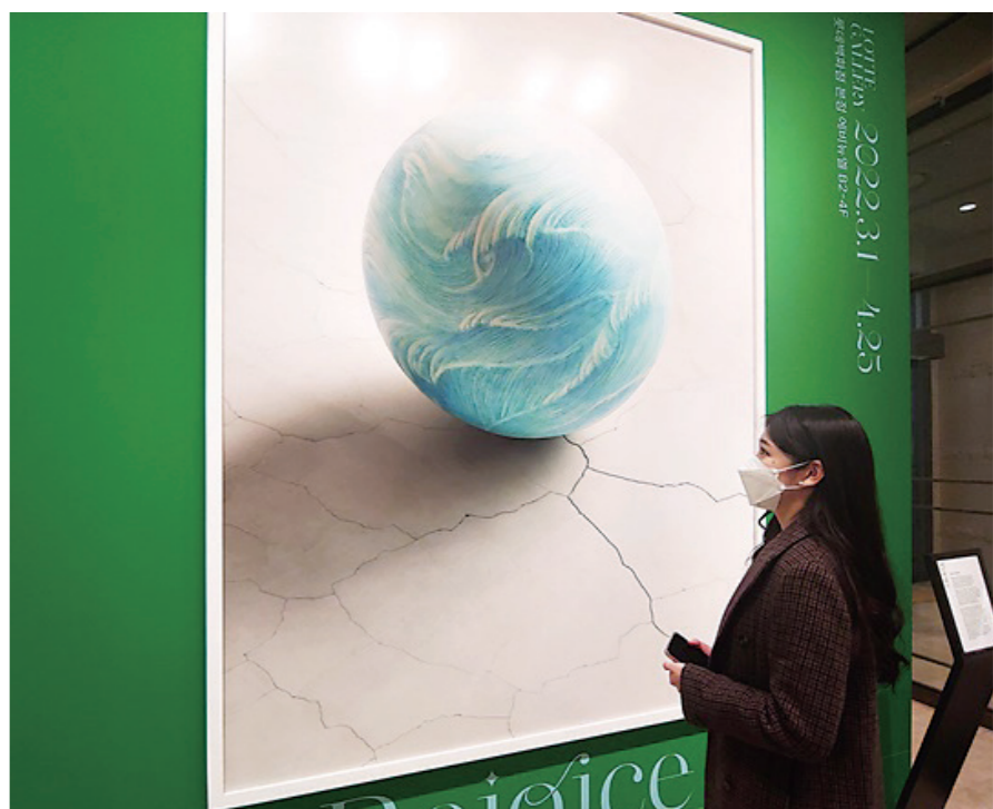
롯데쇼핑 본점 에비뉴에서 세계 여성의 날 기념 여성 아티스트의 작품이 걸려 있다.