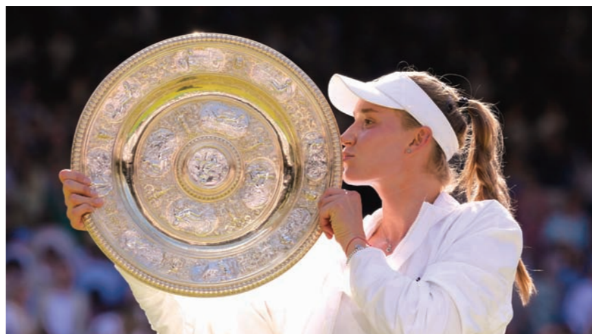
엘레나 리바키나가 9일 2022 웬블던 여자단식에서 우승한 뒤 트로피에 입을 맞추고 있다.

중전 카자흐스탄 선수의 메이저 대회 최고 성적은 남녀를 통틀어 4강이다. 리바키나는 카자흐스탄인으로는 최초로 테니스 메이저 대회 우승자가 됐다.