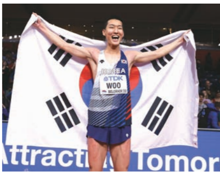
우상혁이 3월 2022 세계실내육상선수권대회 남자 높이뛰기 결선에서 1위를 차지한 후 태극기를 몸에 두르고 기뻐하고 있다.

가장 큰 관심을 모으는 것은 단연 남자 높이뛰기의 우상혁이다. 32명이 출전하는