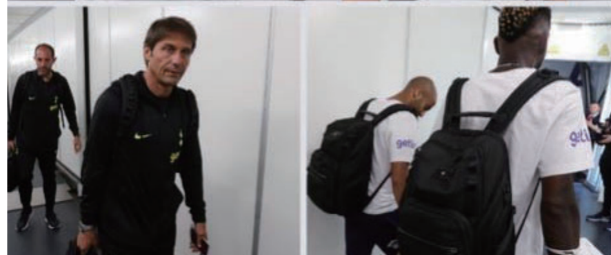
손흥민(30)의 소속 팀인 잉글랜드 프로축구 프리미어리그(EPL) 토트넘 홋스퍼가 최정예로 구성된 한국 투어 명단을 발표했다.