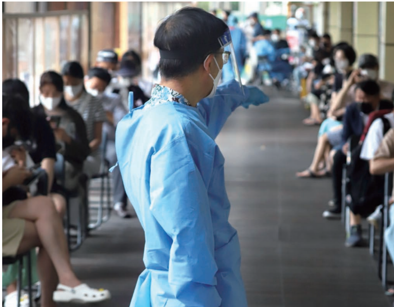
코로나19 확산세 뚜렷 '코로나19 재유행'에 대해 비상 경고등이 켜진 11일 오후 서울 송파보건소를 찾은 시민들이 코로나19 검사를 받기 위해 대기하고 있다. 전문가들은 8월 말이면 하루 확진자가 15만~20만명에 이를 것이라는 암울한 전망을 내놓고 있다.