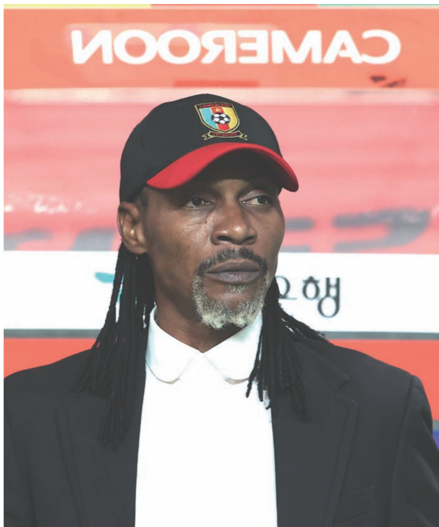
27일 오후 서울 마포구 서울월드컵경기장에서 열린 하나은행 초청 축구 국가대표 평가전 대한민국과 카메룬의 경기, 카메룬 리고베르 송 감독이 국기를 부르고 있다.

손흥민과 대화를 주고받은 장면에 대해선 “축구를 할 때는 페어플레이가 중요하다. 오늘 관중이 많이 왔는데 서로