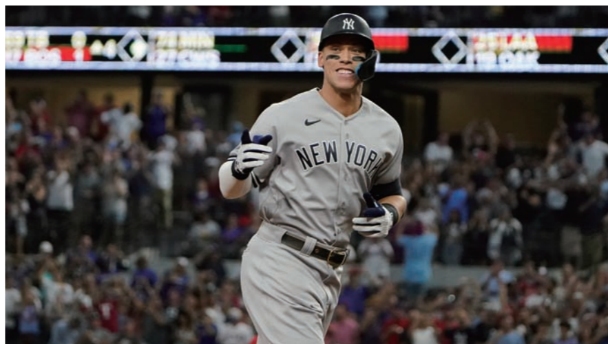
애런 저지가 5일 미국 텍사스주 알링턴의 글로브라이프필드에서 열린 2022 메이저리그 텍사스 레인저스와의 더블헤더 2차전에서 1회 초 62호 홈런을 때려내며 그라운드를 돌고 있다.

야구 팬들은 '청정 타자' 저지의 홈런 신기록을 '진정한 기록'으로 여긴다. AL 한