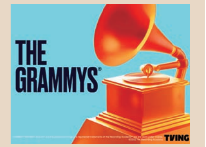
2023년 '제65회 그라미 어워드'에서 미국 배우 비올라 데이비스가 EGOT가 됐다.