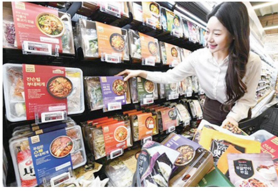
홈플러스의 PB브랜드 '홈플러스시크니처' 제품. 홈플러스

마트는 최근 PB브랜드 강화를 위해 기존에 운영하던 여러 PB제품 라인을 리뉴얼 통합해 '오늘좋은'을 론칭했다. 맛·안전·상·편의성 등에 모두 민감한 30대 워킹맘을 타깃 고객층으로 설정했다. 홈플러스는 PB 초창기인 2019년 11월 고급화·차별화를 목표로 '홈플러스 시크니처'를 론칭한 이후 꾸준히 판매 비중을 높여 왔다. 현재까지 3000여 종의 상품을 출시해 판매 중이다. 이마트도 PB 브랜드 '노브랜드'와 프리미엄 식품 브랜드 '피코크'를 선보이고 있다. 노브랜드는 2015년 출시 이후 품목 수가 1500개로 늘었고 지난해 매출이 전년 대비 5.8% 늘었다. 론칭 10주년이 된 피코크는 2021년 연매출 4000억 원을 넘어선 이후 매년 성장세를 보이고 있다.