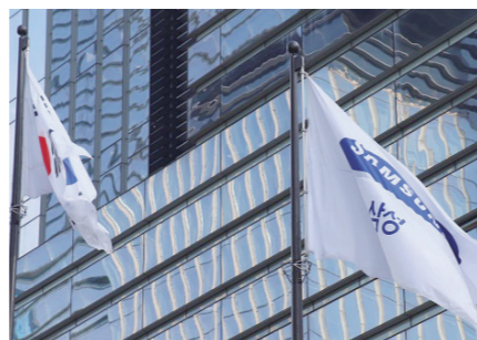
삼성전자가 국내 500대 기업 경영평가에서 4년 연속 1위를 차지했다.

지난해 수출 호조를 이끌어 낸 현대자동차와 기아는 각각 종합 순위 23위를 차지했다. 두 기업 모두 글로벌 경쟁력 부문에서 괄목할 성과를 낸 것이 높게 평가됐다. 현대차는 616.8점을 얻어 지난해에 이어 2년 연속 2위를 유지했고, 지난해 5위에 머물렀던 기아는 올해 601.2점을 기록해 3위로 올랐다. 반면 지난해 종합 순위 3위였던 네이버는 올해 순위권에 오르지 못했다. 올해 종합 순위 13위에 그치며 10위권 밖으로 밀려난 것이다. 부문별로 보면 고성장 부문에서 매출 10조 원 이상 기업 중 우수기업에 이름을 올린 기업은 △GS칼텍스 △대한항공 △HD현대오일뱅크 △에스오일 △LG에너지솔루션 등이다. 미래 성장동력 확보를 위한 투자 부문에서는 삼성전자를 비롯해 △LG화학 △네이버 △카카오 △삼성물산 등이 우수기업에 선정됐다. 삼성전자는 지난해 설비 투