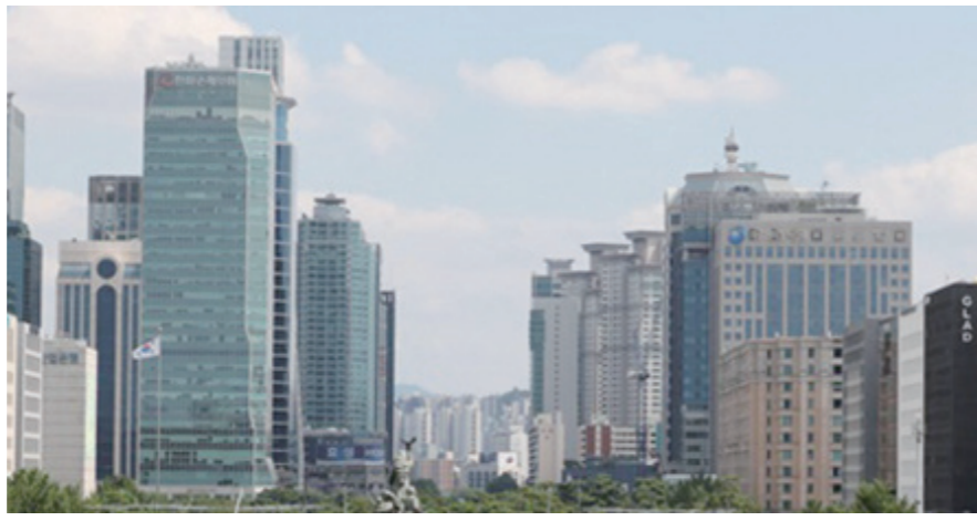
서울 여의도 증권가. 국내 9개 증권사가 발행한 천연가스 레버리지 ETN 중에서 삼성증권과 NH투자증권을 제외한 나머지 7개 증권사가 발행한 상품이 모두 조기청산·상장폐지 절차를 완료했거나 관련 절차를 앞두고 거래가 정지됐다.

삼성·NH투자 제외 7개 증권사 시판상품 '날벼락' 장 종료시점 실시간 지표가치 1000원 미만으로 추락