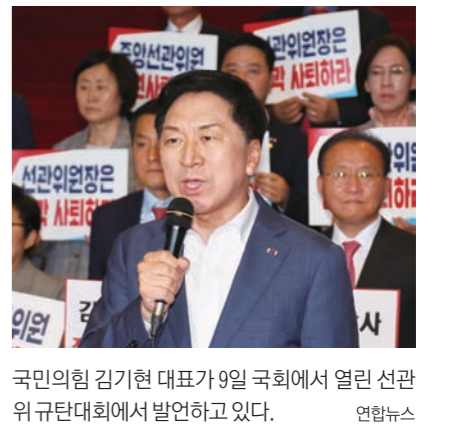
국민의힘 김기현 대표가 9일 국회에서 열린 선관위 규탄대회에서 발언하고 있다.

중앙선거관리위원회가 고위직 자녀 특채 채용 의혹에 대해서만 감사원 감사를 받겠다고 밝힌 것에 대해 국민의 힘은 “전면 사퇴와 함께 전면 감사를 수용하라”고 비판했다. 11일 정치권에 따르면 선관위는 자녀 특채 채용에 한해 감사원 감사를 받기로 했다. 여론의 전방위적인 압박을 버티지 못한 것이다. 2일 선관위는 선관위원 만장일치로 감사원 감사 거부를 결정했다. 이를 일주일 만에 ‘거부’에서 ‘부분수용’으로 입장을 선회한 것이다. 이 같은 결정은 전날 경기 과천 청사에서 노태우 선관위원장 주재로 전원회의에서 나온 것이다. 회의에 참석한 상임위원들은 3시간이 넘는 격론 끝에 고위직 간부 자녀의 특채 채용 문제에 관해 감사원 감사를 받기로 했다. 선관위는 이와 함께 별개로 감사원이 선관위에 감사 권한이 있는지를 두고 권한쟁의심판을 청구하여 헌법재판소의 판단을 구하기로 했다. 선관위는 헌법 97조에 감사원의 직무 감찰 대상이 ‘행정기관 및 그 공무원의 직무’로 돼 있는 점을 근거로 제시했다.