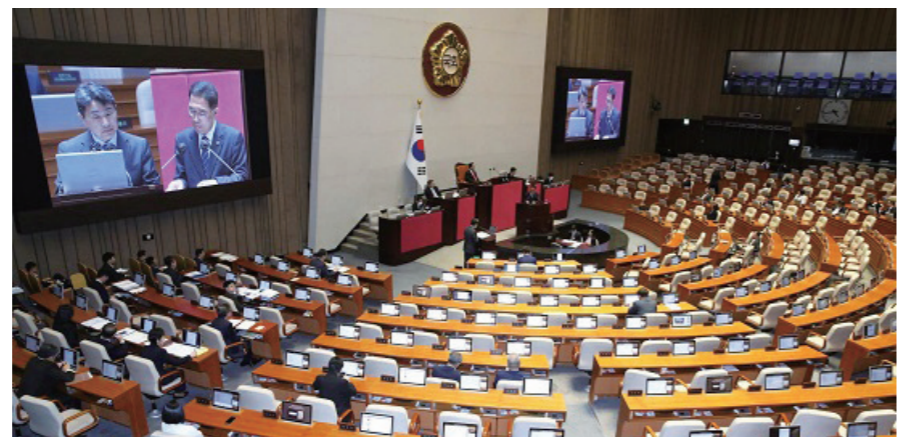
이주호 사회부총리 겸 교육부장관이 4월5일 서울 여의도 국회에서 열린 제405회국회(임시회) 제3차 본회의 교육·사회·문화 분야 대정부질문에서 의원의 질문에 답변하고 있다.

국힘, '자녀 특채·北 해킹 은폐' 의혹 공세나 설 듯 민주, '이동관 아들·방송 장악·노정 갈등' 강공