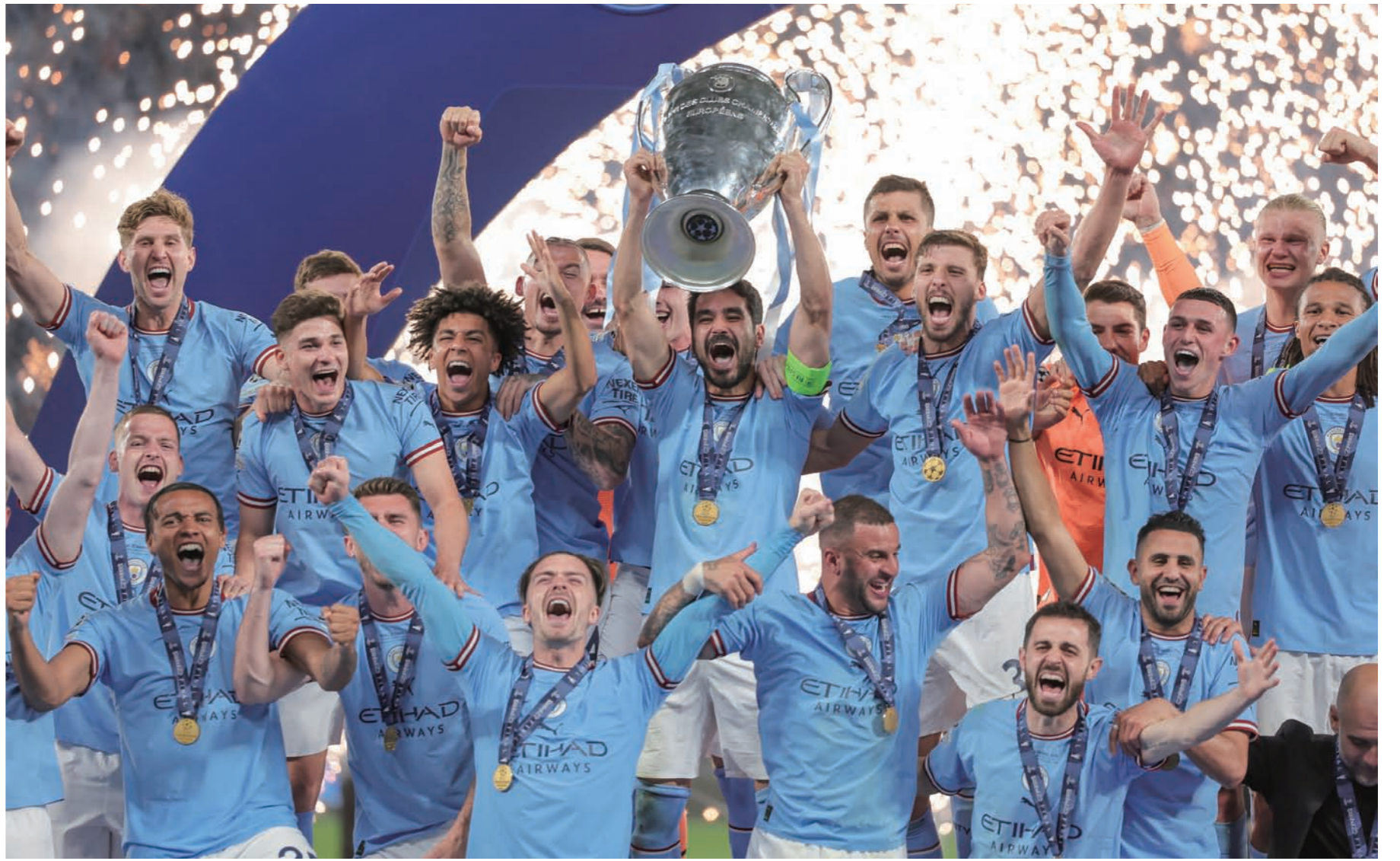
맨시티 주장 일카이 칸도안(가운데)이 2022-23 UCL 시상식에서 빅이거를 치켜 올리며 동료들과 환호하고 있다.

패배 위기에 몰린 인터밀란이 총공세를 펼쳤지만 맨시티 수비진과 GK 에데르송의 단단한 수비벽을 뚫지 못했다. 특히 에데르송은 후반 43분과 경기 종료 직전 인터밀란의 결정적 헤더를 두 차례나 막아냈다. 박병현 기자 bhpark@skyedaily.com