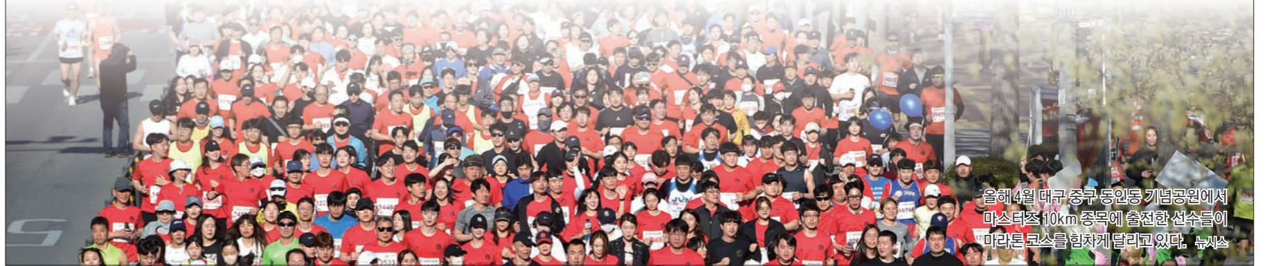
올해 4월 대구 중구 동인동 기념공원에서 마스터즈 10km 종목에 출전한 선수들이 마라톤 코스를 협력체 달리고 있다. 뉴스

홍 시장은 "이 대회를 계기로 대구가 국제육상도시로서의 위상을 한층 더 높고 할 수 있을 것으로 기대한다"고 말했다. 김명준 기자 mjkim@skyedaily.com