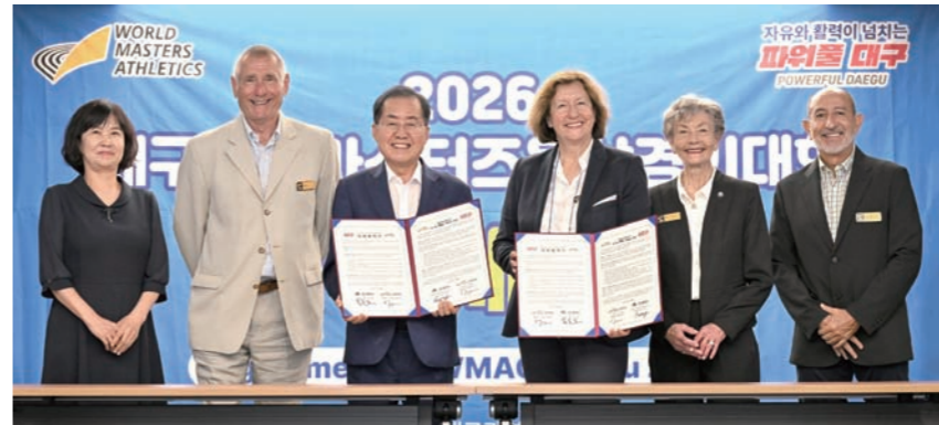
대구시와 세계마스터즈육상연맹은 산격청사 대회의실에서 '2026대구세계마스터즈육상경기대회'의 성공적 개최를 위한 상호 협약을 체결했다. 대구시

상연맹(IAAF) 세계 육상선수권대회를 9일간 대구 스타디움에서 개최해 육상계에서는 인지도가 높은 편이다.