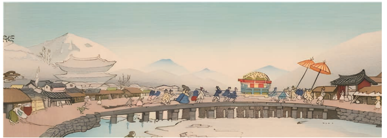
엘리자베스 키스 그림 '신부행차'(1921).

100년 전 이방인의 시선으로 바라본 신비로운 한국 풍경과 함께 나라의 주권을