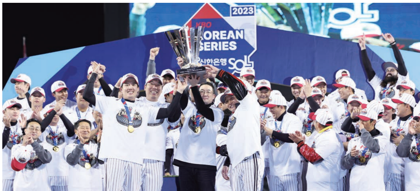
13일 서울 잠실야구장에서 열린 2023 KBO 한국시리즈 5차전 kt 위즈와 LG 트윈스의 경기에서 kt를 6-2로 꺾고 우승을 차지한 LG 선수들이 트로피와 함께 기뻐하고 있다.

2021년 KT위즈 우승 당시에는 KT그룹 사 캐시백이 연 2.1% 금리 정기예금 상품을 출시하고 KT위즈 최고의 선수에 투