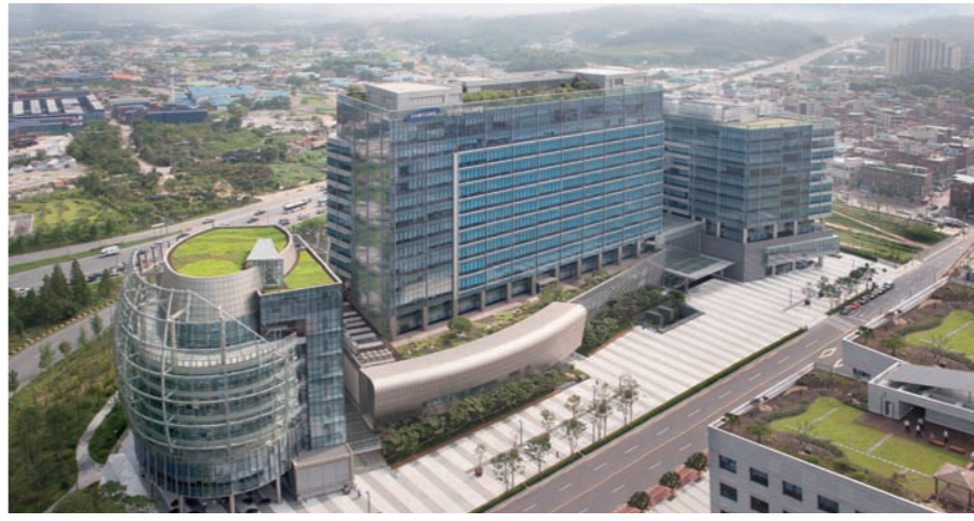
삼성엔지니어링은 올해 신규 수주 목표치를 12조 원대로 제시하고 미래 기술 확보를 위한 투자를 확대했다. 삼성엔지니어링

올해 삼성엔지니어링의 주요 입찰 프로젝트는 △사우디 Fadhili Gas 40억 달러