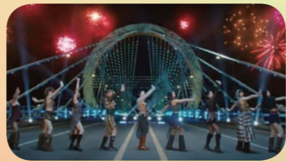
지난달 23일 발매한 걸그룹 트와이스의 13번째 미니앨범 '위드 유-스'가 빌보드200 차트 1위를 기록했다. 앨범 타이틀 곡 'One Spark'(원스파크)의 뮤직비디오 캡처(아래).

데뷔 10년 차를 맞은 걸그룹 트와이스가 최근 발표한 13번째 미니앨범 '위드 유-스'(With YOU-th)로 '빌보드200' 1위를 기록했다. 아이돌 가수로서 이례적으로 데뷔 10년 차에도 정상을 달리고 있다. 변함없는 결속력으로 끊임없이 발전하는 모습을 증명한 셈이다.