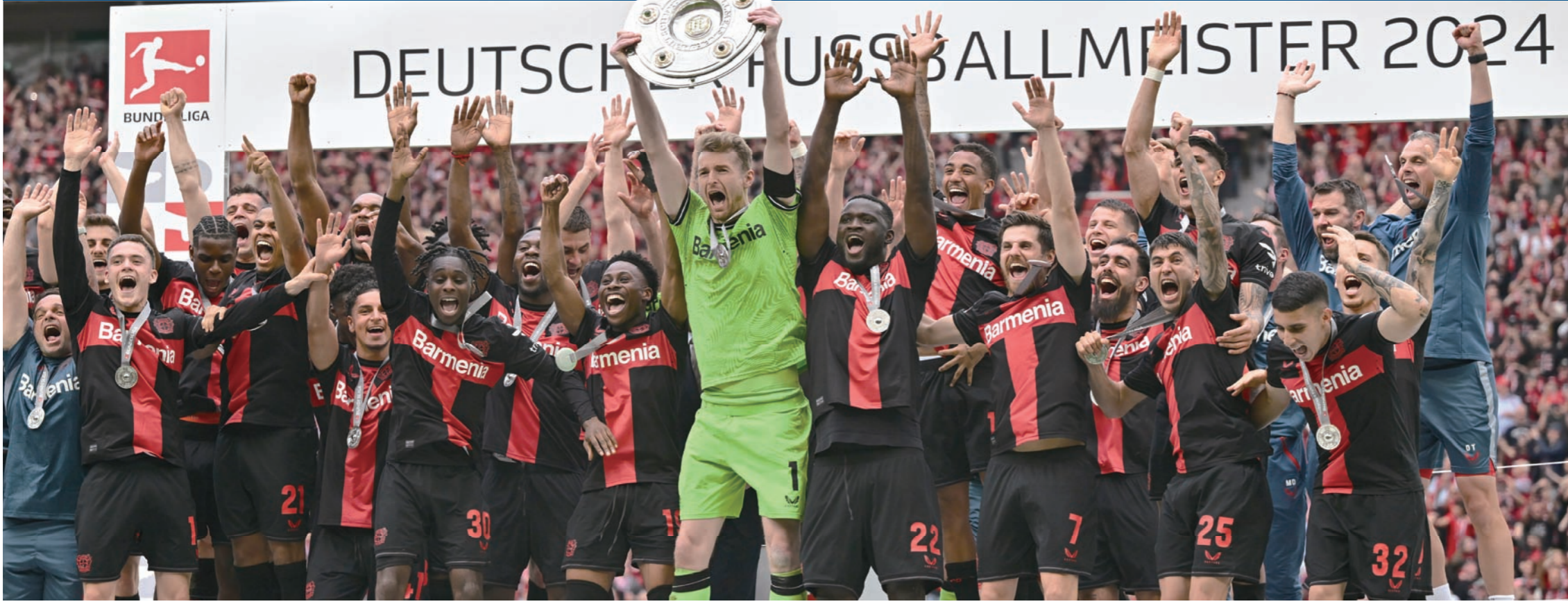
독일 프로축구 바이어 레버쿠젠 선수들이 19일(한국시간) 분데스리가 시상식 단상에서 우승컵을 치켜들며 환호하고 있다.