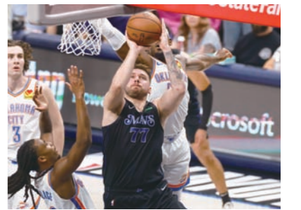
미 프로농구(NBA) 댈러스 매버릭스의 간판스타 루카 돈치치(가운데)가 19일(한국시간) 오클라호마시티와의 서부 콘퍼런스 2라운드 6차전에서 수비를 높고 골밑 슈팅을 시도하고 있다.

미국프로농구(NBA) 댈러스 매버릭스가 17점 차 열세를 뒤집고 2년 만에 서부 콘퍼런스 결승에 다시 올랐다. 댈러스는 19일(한국시간) 미국 텍사스주 댈러스의 아메리칸 에어라인스 센터에서 열린 2023-24 NBA 플레이오프(PO) 서부 콘퍼런스 2라운드(7전 4승제) 6차전 홈 경기에서 서부 1위인 돌풍의 오클라호마시티 선더를 117-116으로 꺾었다. 4승 2패로 시리즈를 통과한 댈러스는 2021-22시즌 이후 2년 만에 다시 서부 콘퍼런스 결승에 진출했다. 정규리그에서 50승 32패를 기록해 서부 5위에 오른 댈러스는 오클라호마시티(57승 25패)를 상대로 1점 차 짜릿한 승리를 거뒀다.