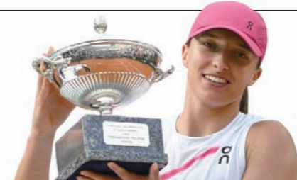
클레이코트에 강한 시비용테크는 프랑스 오픈에서 2020년을 시작으로 2022년, 2023년까지 세 번 우승했다.

랑스오픈을 앞두고 시비용테크는 2013년 세리나 윌리엄스(은퇴·미국) 이후 11년 만에 마드리드오픈과 BNL 이탈리아 인터내셔널 단식을 연달아 제패한 선수가 됐다.