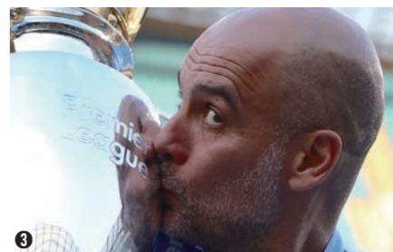
1 잉글랜드 프로축구 맨체스터시티의 주장인 카일 워커(왼쪽) 등 선수들이 20일(한국시간) 영국 맨체스터의 에티하드 스타디움에서 거행된 시상식에서 우승트로피를 들어올리며 환호하고 있다. 2 잉글랜드 프로축구 맨체스터시티 선수들이 20일(한국시간) 웨스트햄 유나이티드를 꺾고 우승이 확정되자 그라운드를 질주하며 환호하고 있다. 3 맨체스터 시티의 펠리 포든이 20일(한국시간) EPL 4연패를 확정짓는 뒤 우승컵에 입을 맞추고 있다.