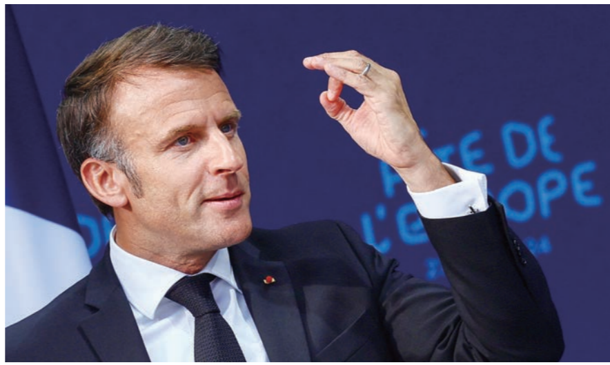
독일을 국민방문 중인 에마누엘 마크롱 프랑스 대통령이 27일(현지시간) 드레스덴의 광장에서 1만5000명 청 중을 향해 연설했다. 그는 유럽연합(EU) 쌍두마차인 양국의 이번 만남을 “유럽 현대사의 가장 중요한 순간” 으로 짚으며 미국 의존 대신 유럽의 홀로서기가 절실했음을 강조했다.

“미국의 적극적인 우크라이나 지원은 유럽으 로서 행운”이지만 “항상 이런 노력을 요구 하는 게 합리적인지 자문해봐야 한다”는 마크롱 발언이 특히 주목된다. 2차 세계 대전 이후 국제질서의 종식을 공개적으로 인정한 대목이다. 15세기 대항해시대 이래 세상을 주도하던 유럽이 20세기 두 차례 의 대전을 통해 자멸적 상황에 놓였으며 미국의 개입으로 겨우 수습됐다.