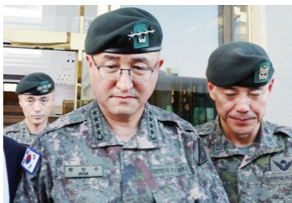
박인수(왼쪽) 육군참모총장이 28일 오후 전남 나주시 한 장례식장에 마련된 '군기훈련 사망 훈련병'의 빈소를 조문한 뒤 이동하고 있다.

21일에는 육군 제32보병사단 신병교육대에서 수류탄 투척 훈련을 하던 중 수류탄이 폭발해 훈련병 1명이 숨지고 소대장 1명이 크게 다쳤다. 사고 원인은 사망한 훈련병이 수류탄 투척을 위해 안전권을 뽑았으나 던지지 못해 폭발한 것으로 알려