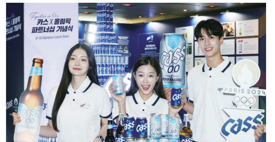
파리올림픽 개막을 한달 앞둔 26일, 주류 업계 최초로 올림픽 공식 파트너 브랜드로 선정된 카스가 서울 광진구 위커피호텔에서 주최한 기념 행사에서 2024 프랑스 파리 올림픽의 성공적 개최와 팀 코리아의 선전을 기원하고 있다.