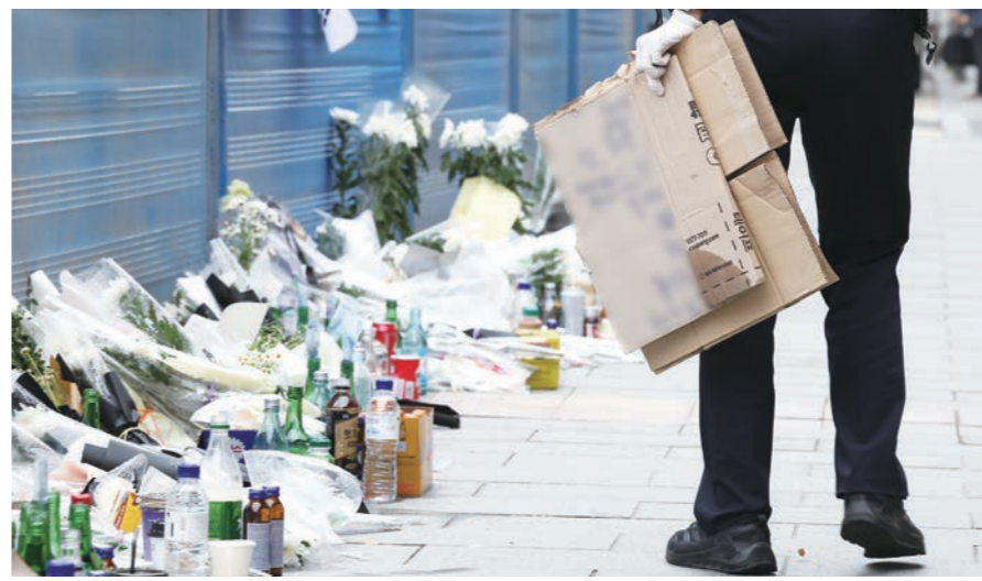
경찰관들이 5일 서울 중구 시청역 인근 역주행 사고 현장에 마련된 추모 공간에서 추모글을 빗자루로 쓸어내리고 있다.

이 차에 치인 모습을 “벌링벌”이라고 비유하는 사이코패스적인 댓글을 달았고, 이에 상당수의 여성시대 이용자는 “ㅋㅋㅋ”라고 웃으며 여기에 동조했다. 여성시대는 100만 명에 육박하는 초대형 여초 커뮤니티로 여성만 가입할 수 있다. 지난 대선 때 이재명 대표가 직접 방문해 인증을 하고 자신을 지지해 달라는 글을 남긴 바 있다. 소신있는 여성 기자, 이들의 만행 기사화 여초 커뮤니티의 이 같은 만행을 한 소신 있는 여기자가 단독기사를 쓰며 공론화시켰다. 반응은 폭발적이었다. 이 기사를 필두로 조선중앙·동아일보 같은 메이저 언론사는 물론 국민일보·세계일보 같은 중견 언론사들도 앞 다퉈 여초 커뮤니티의 남자 희생자 조롱을 기사화했다. 한 여기자의 용기있는 행동이 미온적이던 언론의 태도를 바꿔 버린 것이다. 여기자에 집단 린치 시작 상황이 이렇게 흘러가자 여초 커뮤니티 이용자들은 해당 여기자를 향해 차마 입에 담을 수 없는 악플을 쏟아냈다. 남자에게 잘 보이기 위해 여성을 팔아먹는다는 등의 내용이 주를 이뤘는데, 성범죄에 가까운 성적 비하도 서슴지 않았다. 이들은 해당 여기자 SNS에 몰려가 집단