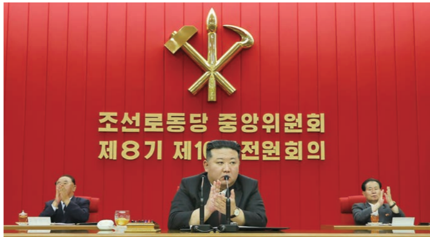
김정은 북한 국무위원장이 지난달 28일~7월1일까지 나흘간 열린 노동당 중앙위원회 제8기 제10차 전원회의에서 "경제 상황이 확연한 상승세"라며 경제 정책 성과에 만족감을 드러냈다고 조선중앙통신이 2일 보도했다.

인민정권을 수립하자는 것이다. 그러므로 민족해방은 ‘미제 축출=주한미군 철수+주화’를, (인민)민주주의혁명은 ‘남한 정권 타도 후 인민정권 수립+민주화’를 의미하는 것이다. 이후 북한은 2단계로 남북 협조에 의한 사회주의혁명을 진행시켜 이른바 전조선 혁명을 완성한다는 전략이다. 북한의 전조선 혁명 전략은 김일성과 김정일 정권에서 체계화된 것인데, 김정은 정권도 이를 계승하고 있다. 북한은 조선로동당 제7차 당대회에서 개정된 ‘조선로동당 규약’ 전문에서 ‘조선로동당의 당면 목적은 공화국 북반부에서 사회주의 강성 국가를 건설하며, 전국적 범위에서 민족해방민주주의혁명 과업을 수행하는 데 있으며, 최종 목적은 온 사회를 김일성-김정일주의화하여 인민 대중의 자주성을 실현하는 데 있다’고 적시하고 있다. 북한이 남한을 상대로 해결하거나 성취하고자 하는 목적은 크게 두 가지로 나누어 볼 수 있다. 첫 번째 목적은 남한 지역에서 민족해방민주주의혁명을 완수하는 것이고, 두 번째 목적은 남북통일을 이룩하는 것이다. 북한 정권은 국제·국내 및 대남