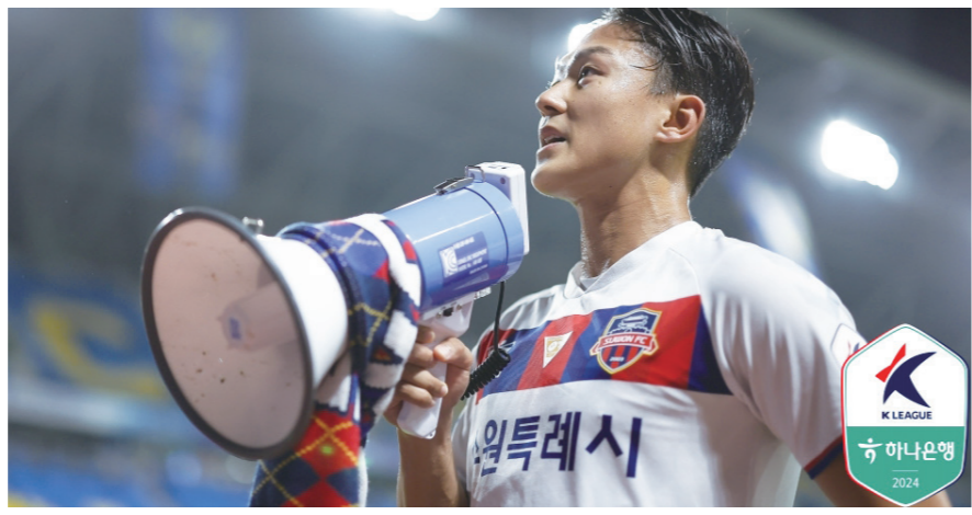
이승우가 21일 인천전용구장에서 열린 인천 유나이티드와의 하나은행 K리그1 2024 24라운드 원정 경기에서 팀이 4-1로 승리한 뒤 서포터스석에서 직접 자신의 전북 이적 소식을 팬들에게 전하고 있다.

전북 관계자는 22일 "계약이 진행되고 있고 메디컬 테스트가 남아 있다"며 "조만간 영입을 공식 발표할 예정이다"고 전했다. 이로써 이승우는 2021년 12월 수원 FC 유니폼을 입은 이후 2년 7개월 동안 88경기에 나서 34골 8도움의 기록을 남기고 전북으로 옮겨 새롭게 선수 경력을 이어나가게 됐다.