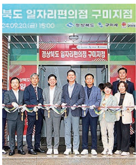
경상북도는 20일 구미여성인력개발센터에서 '일자리 편의점 경북1호점 구미지점' 개소식을 했다. 경상북도