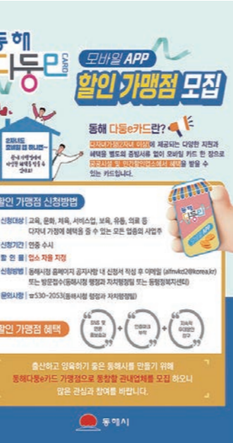
강원특별자치도 동해시는 도내 최초로 추진 중인 '동해 다동e카드' 모바일 앱 개발 완료로 앞두고 다자녀 가구에 할인 혜택을 줄 민간 할인가맹점 모집을 시작한다. 동해시

또한 '동해 다동e카드' 모바일 앱 개발 용역 완료 예정인 10월 말에 맞춰 민간 할인가맹점 모집에 나섰다. 이는 모바일 앱 상용화 시점에 맞춰 이