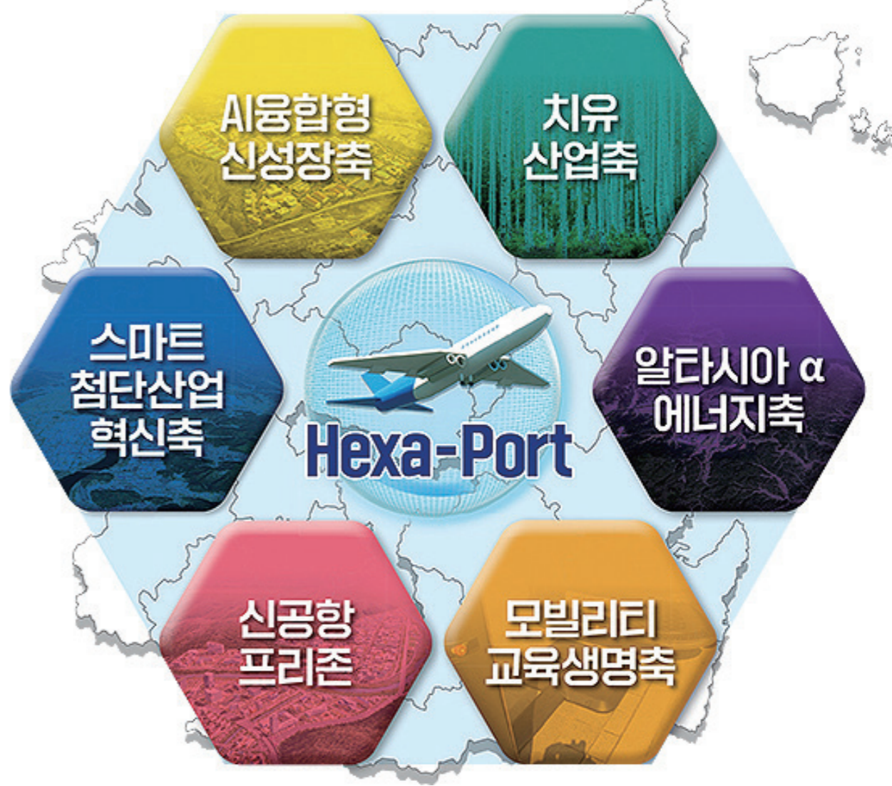
경상북도는 대구경북공항 배후신도시 의성군을 도 전역 발전을 견인하는 글로벌 복합 신도시로 만들고자 총력을 기울이고 있다. 도는 의성군 신공항 프리존을 경북 Hexa Port의 중심으로 조성한다. Hexa Port 개념도. 경상북도

도는 K콘텐츠 한류 테마파크, 산업역사관과 기업관 등을 포함한 1조 원 규모의 의성 문화 관광단지에 대한 기본구상과 타당성 검토 용역을 추진 중으로 2026년도 신규 관광단지 지정 신청을 목표로