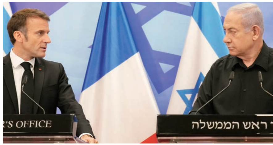
지난해 10월 하마스 기습 사태 직후 전쟁을 결심한 네타냐후(오른쪽) 이스라엘 총리와 이를 밀리러 이스라엘을 방문한 마크롱 프랑스 대통령. 최근 헤즈볼라 소탕을 위한 이스라엘군 작전 중 유엔평화유지군이 피해를 입자 마크롱은 15일(현지시간) 이스라엘을 향해 '유엔이 세워 준 나라임을 잊지 말고 유엔 결정에 따라라' 취지의 발언을 했다. 네타냐후가 반박 성명을 내면서 이스라엘 건국논쟁이 벌어졌다.

팔레스타인 땅 약 56%를 유대인에 분할해 준다는 결의안 181호가 통과됐다. 이듬해 5월14일 팔레스타인 분리독립 확정과 동시에 이 지역 유대인 공동체들과 전 세계에 흩어져 있던 유대인들 등이 모여 이곳에서 이스라엘 건국을 선언했다(당시 인구 80만 명 정도). 제1차 중동전쟁 즉 '이스라엘 건국전쟁'은 이 기쁨날 터졌다.