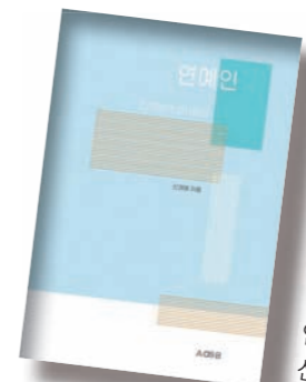
연예인 신경애 저

'연예인'은 연예인이 단순한 인기 스타가 아니라 시대의 리더이자 문화창조자로서