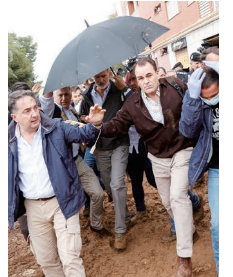
지난달 기록적인 홍수로 스페인 바렌시아주(州)가 큰 피해를 입었다. 3일(현지시간) 파이포르타 수재민들을 찾은 펠리페6세(우산 밑) 국왕 일행이 당국의 늑장 대응에 분노한 시민들에게 욕설과 진흙·오물 세례를 받았다. 펠리페6세가 우산으로 경호를 받으며 현장을 떠나고 있다.

스 총리는 2일 기자회견에서 피해지역에 군·경 1만 명의 추가 파견을 약속했다. 군인 7500명·경찰 9000여 명이 생존자 수색과 시신 수습 등에 나서게 된다. 피해 지역은 중앙정부에 실종자 수색과 구호·복구 작업 지원이 절실하다. 마리벨 알발라트 파이포르타 시장은 유로파 프레스에 도시 내 여러 지역에 여전히 접근조차 할 수 없다며 "차 안에 시신이 있어 수습해야 한다"고 토로했다. 산체스 총리는 상황의 심각성을 인정하며 "과실을 살피고 책임 소재를 파악하겠다"면서도 "지금 은 단합할 때"라고 호소했다.