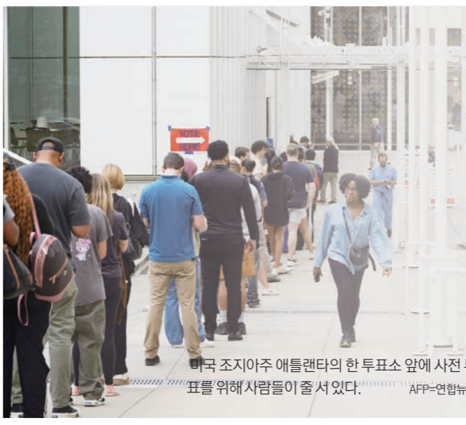
미국 조지아주 애틀랜타의 한 투표소 앞에 사전투표를 위해 사람들이 줄 서 있다.

선거인단 제도에선 사표가 발생하기 마련이라 민의를 제대로 반영하지 못한다는 비판이 있으나 헌법을 고쳐야만 하므로 쉽지 않다. 만일 이번 선거에서 엄청난 불복 상황이 발생한다면 제도 개선 관련 논의가 일어날지 모른다. 2016년 대선에서 힐러리 클린턴 후보는 약 280만 표를 더 많이 얻고도 선거인단 수에서 밀려 트럼프에게 패했다. 2000년 조지 부시 전 대통령 역시 민주당 후보 앨 고어보다 50만 표 이상 적게 얻고도 대통령이 될 수 있었다. 특정 정당에 압도적 지지를 몰아준다 해서 '블루 스테이트'(민주당) '레드 스테이트'(공화당)로 불리는 곳들이 있다. 각 주의 지배적 정치 성향은 지난 20년간 큰 변화를 겪었다. 공화당-민주당 지역이었다가 달라졌거나 매번 지지 정당(후보)이 바뀌