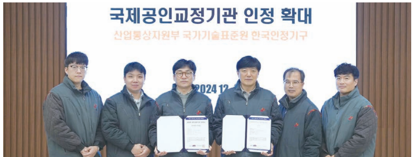
국제공인교정기관 인정 확대 산업통상자원부 국가기술표준원 한국인정기구

SK온은 독자 공인교정기관을 운영하고 있는 만큼 외부 기관을 활용할 때보다 비용 및 시간을 절약할 수 있다는 장점이 있다. 통상적으로 배터리 제조기업들은 자사 배터리 평가 장비가 균일한 성능을 유지하도록 매년 외부 공인교정기관으로부터 검증을 받아야 하는데, 이런 절차 및