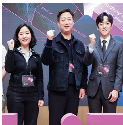
홍범식 LG유플러스 사장(가운데)과 슈프트 참여 스타트업 대표들이 기념 촬영을 하고 있다.

LG유플러스 울산 사옥에서 열린 슈프트 데모데이는 프로그램에서 선발된 스타트업에 대한 외부 투자를 유치하고 LG유플러스와의 기술 협력을 본격적으로 논의