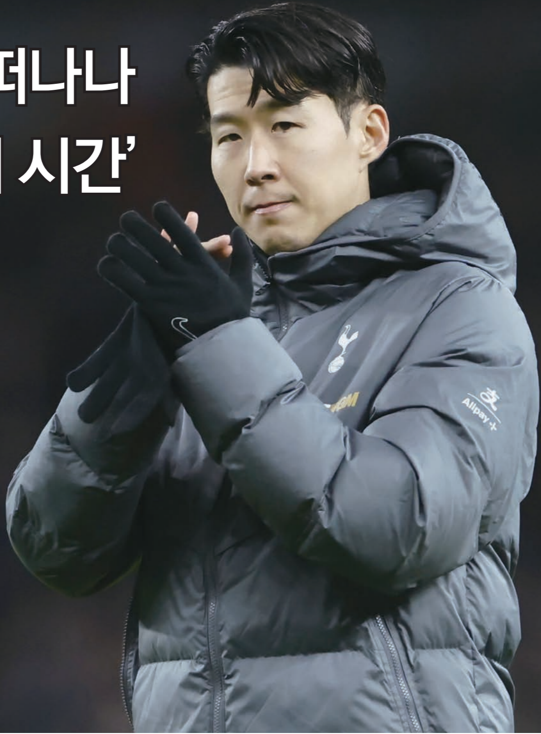
영국 프로축구 프리미어리그(EPL) 겨울 이적시장이 열리면서 올 여름 토티넘과 계약이 끝나는 손흥민의 '계약 연장' 여부를 놓고 관심이 뜨겁다.