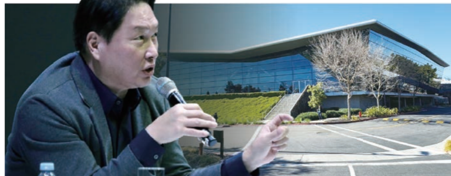
8일(현지시간) 미국 라스베이거스에서 열린 CES 2025에 참석한 최태원(왼쪽) SK 회장이 SK 전시 부스에 마련된 비즈니스 라운지에서 질의 응답을 진행하고 있다.

최 회장은 AI는 선택사항이 아니고 인터넷 환경이나 증기기관처럼 모든 분야에 걸쳐 전방위적 변화를 만들고 있는 산업이라고 언급하면서 가능하면 최전선에 서서 이 변화를 이끌어 갈 것이냐 따라갈 것이