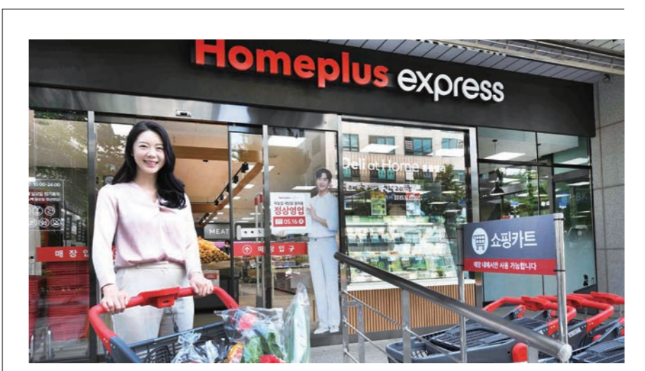
홈플러스는 SSM(기업형 슈퍼마켓) 사업 ‘홈플러스 익스프레스’ 인수자를 모색 중이다. 홈플러스