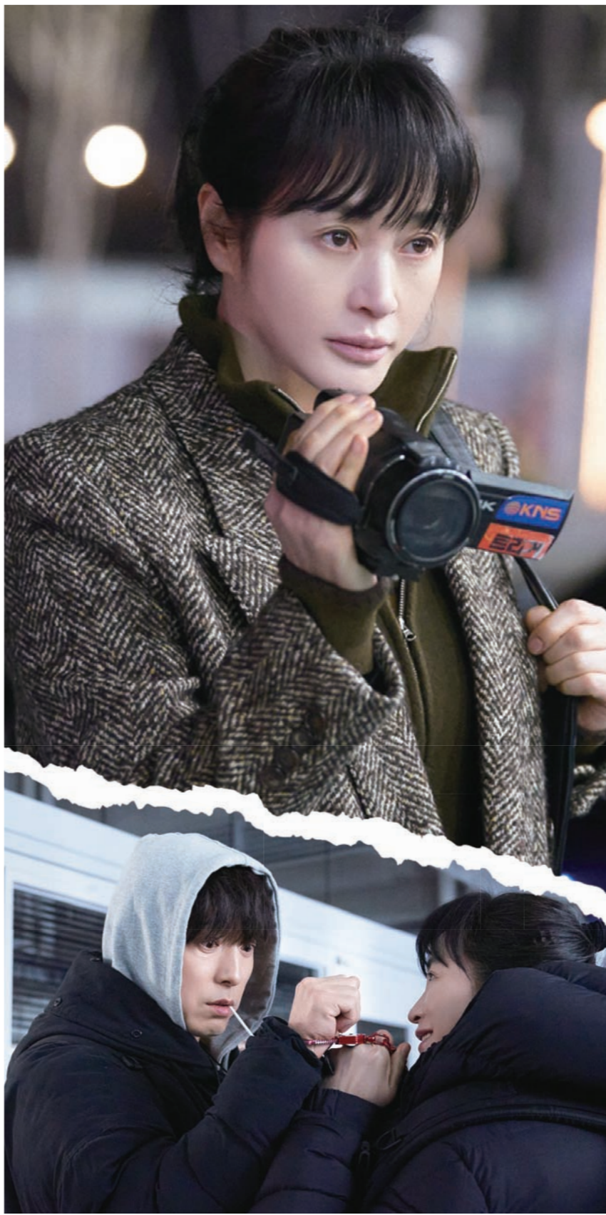
디즈니+의 오리지널 시리즈 '트리거'가 화제다. '트리거' 장면들. 월트디즈니컴퍼니코리아

"우리는 목숨을 걸고서라도 안에 들어 가서 증거를 찍어야 해. 그래야 나쁜 짓을 멈추니까. 다른 이유? 그만 거 없어."