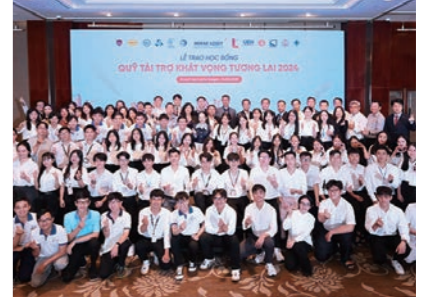
미래에셋재단이 18일 진행한 베트남 현지 우수 학생 장학금 수여식.

미래에셋그룹의 베트남 사회공헌재단인 '미래희망재단'이 현지 우수 학생에게 장학금을 수여했다. 미래희망재단은 최근 현지 우수 학생을 대상으로 장학금 수여식을 개최했다고 18일 밝혔다. 이번 장학금 수여식은 현지 인재 육성과 지역사회의 발전에 일환으로 진행됐고 가계소득·학업성적 등을 종합적으로 심사해 최종 선발된 210명의 학생에게 장학증서가 수여됐다. 미래희망재단은 2022년 베트남에서 설립된 이후 현재까지 14개 학교에서 해외 교환 장학생 15명을 포함해 약 600명의 장학생을 선발하고 총 140억 동(약 8억 원)의 장학금을 지원하며 현지 교육 발전에 기여해 온 것으로 알려졌다. 미래에셋그룹은 자사 장학 프로그램을