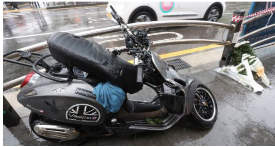
서울 중구 무교동 교통사고 현장에 조화가 놓여 있다.

KB손보 0.9%·현대해상 0.6%·삼성화재 1%↓ 대형 손해보험사 최대 1% 보험료 인하 결정