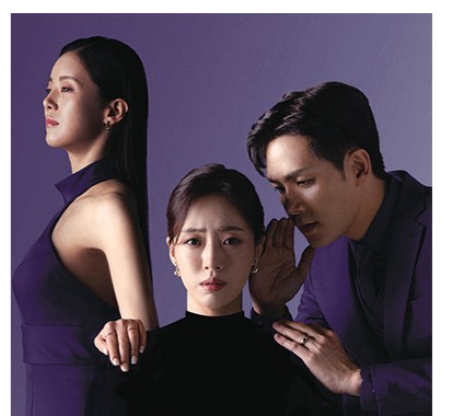
KBS 2TV 일일드라마 '신데렐라 게임'의 후속작 '여왕의 집'이 28일부터 방영된다. '여왕의 집' 포스터. KBS

아프리카 비트 위에 국악 장단과 추임새를 더한 것이 특징으로 미국 빌보드 메인 싱글차트 '핫 100' 11위, 영국 오�피셜 싱글차트 '톱 100' 21위에 올랐다.