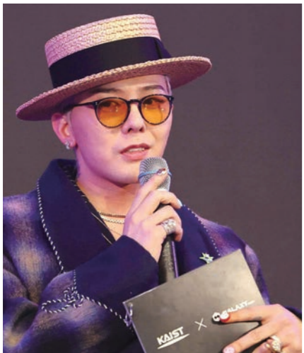
그림 빅뱅의 멤버이자 카이스트 기계공학과 초빙교수인 지드래곤(권지용)이 9일 대전 카이스트에서 열린 행사에 참석해 엔터테인먼트 산업과 과학기술의 협력에 대해 말하고 있다.

가수 지드래곤의 음원과 홍채 이미지가 한국과학기술원(KAIST)의 위성기술에 의해 우주로 송출됐다.