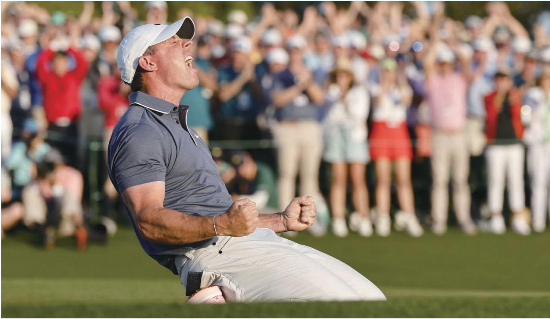
로리 매킬로이가 13일(현지 시간) 미국 조지아주 오거스타 내셔널 골프클럽에서 열린 제89회 마스터스 토너먼트 최종 라운드 연장전에서 잉글랜드의 저스틴 로즈를 누르고 승리한 후 포효하고 있다.